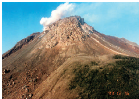
雲仙・普賢岳に形成された溶岩ドーム

かけました。国土交通省からの支援を受け、平成3年8月に「'91火山砂防フォーラム（委員長：群馬県嬭恋村長）」が、同県草津町内で開催されました。フォーラムにおいては、当会を継続的に開催することが実行委員より提案され、「'91火山砂防フォーラム実行委員会」は、平成3年に「火山砂防フォーラム委員会」と改称し、規約を定めて活動を行っています。2022年7月現在、全国104の市町村が加盟しています。