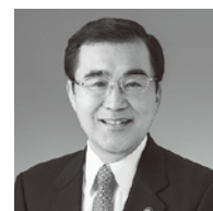
鹿児島市長 森 博幸