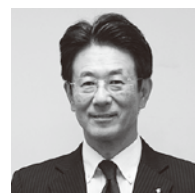
鹿児島県危機管理局长 木場 信人