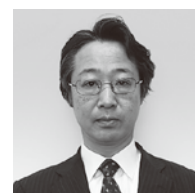
国土交通省 九州地方整備局 大隅河川国道事務所長 吉柳 岳志