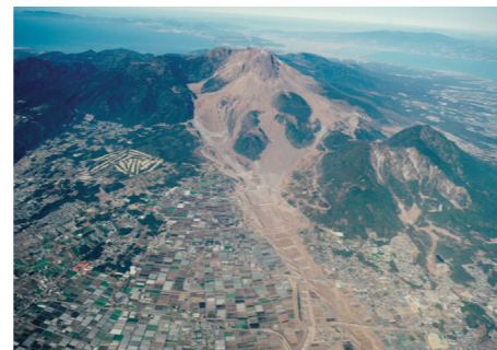
土石流による被害(1991,7,1)