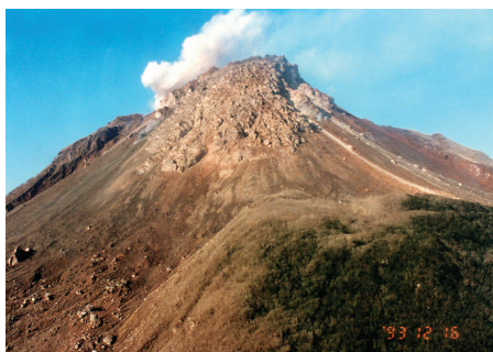
雲仙・普賢岳に形成された溶岩ドーム