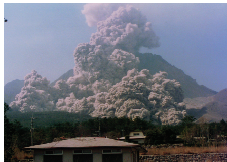
民家に迫る火砕流(1991,5,26)