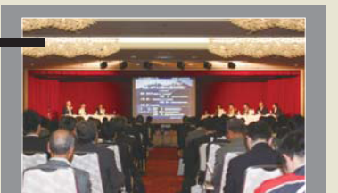
■火山地域の振興と防災に関する討論 福島県北塩原村(2013年)

火山地域ならではの防災対策等、安全で活力ある地域づくりに向けた意見交換を行います。