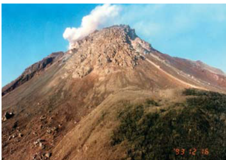
雲仙・普賢岳に形成された溶岩ドーム

かけました。国土交通省からの支援を受け、平成3年8月に「'91火山砂防フォーラム（委員長：群馬県嬭恋村長）」が、同県草津町内で開催されました。フォーラムにおいては、当会を継続的に開催することが実行委員より提案され、「'91火山砂防フォーラム実行委員会」は、平成3年に「火山砂防フォーラム委員会」と改称し、規約を定めて活動を行っています。平成28年5月現在、全国101の市町村が加盟しています。