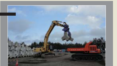
■浅間山噴火総合防災訓練視察 群馬県嬭恋村(2010年)

有事を想定した防災関係機関の情報伝達訓練や緊急施工訓練等を視察し、防災技術の研鑽を図ります。