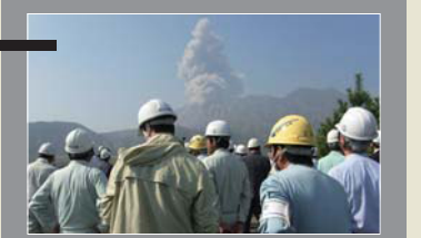
■噴煙を上げる桜島視察 鹿児島県鹿児島市(2009年)

火山砂防施設や監視・観測機器など火山噴火対策の現場を巡り、防災対策技術の共有を図ります。