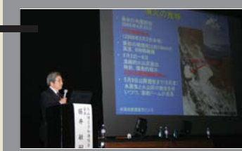
■学識者による基調講演 新潟県糸魚川市(2008年)

最新の噴火対応事例や噴火活動の経過報告など、各方面の専門家からの情報提供を行います。