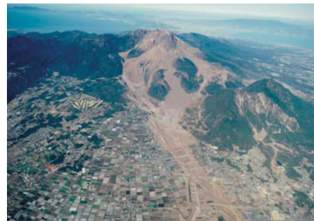
土石流による被害(1991.7.1)