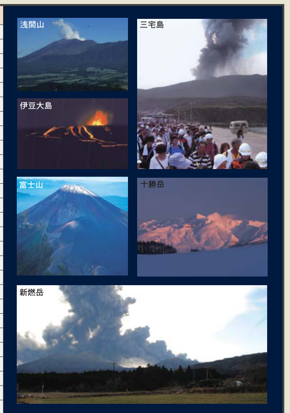
※平成26年5月時点(予定含む)