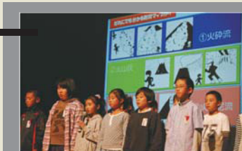
■地元小学生による研究発表 秋田県仙北市(2012年)

火山全般について研究した成果の発表を通じて、火山防災や砂防に係る啓発を行います。