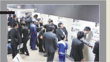
■火山噴火対策に関する情報交換 秋田県仙北市(2012年)

火山を活かしたまちづくりや防災の取り組み事例について紹介し、活発な意見交換の場を提供します。